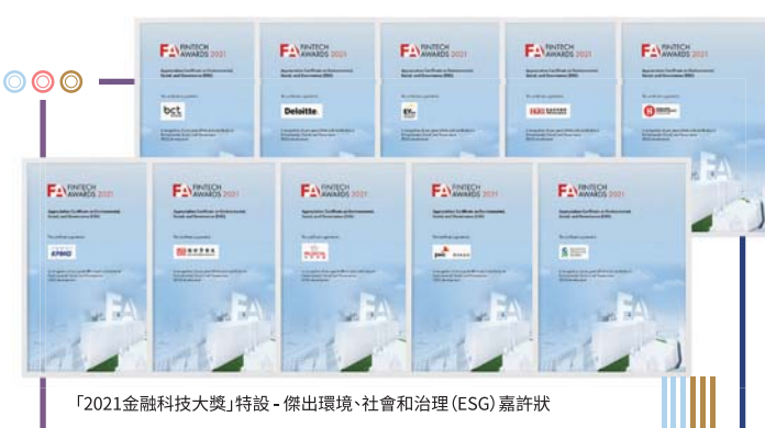
「2021金融科技大獎」特設-傑出環境、社會和治理(ESG)嘉許狀

經濟通(ET Net)面對著數碼科技的不斷進步,也能保持著獨特的市場觸覺,竭力地提供成熟的金融監管制度和嶄新的數碼技術,促進本地的金融科技技術的發展。承著金融科技日新月異的改革,和市場在新冠肺炎持續的變化之下,由經濟通(ET Net)主辦的「2021金融科技大獎」透過網上頒獎典禮順利頒發獎項予得獎者,獎項劃分成18個領域,共頒發54個獎項及3個年度大獎。今年大會主題是「Building a Brighter Green Future Together 共建更美好的綠色未來」為主題,在金融科技已成大勢所趨之際,各持份者如何善用金融科技為本地添加簇新的綠色科技和ESG的元素,在新常態下的挑戰,有效地加強企業的風險管理和在投資決策上有前瞻性的正面影響。