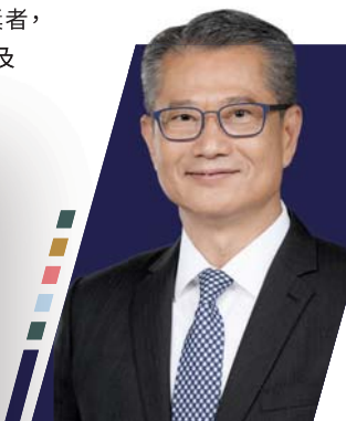
▲ 香港特別行政區政府財政司司長陳茂波先生,大紫荊勳賢,GBS,MH,JP為「2021金融科技大獎」題辭,「研科求進 惠業匡羣」及致辭

香港作為國際金融中心,面對金融科技產業持續蓬勃的發展,讓傳統產業亦致力推動創新科技。感謝香港特別行政區政府財政司司長陳茂波先生,大紫荊勳賢,GBS,MH,JP連續第三年為「金融科技大獎」題辭,而致辭中指出在新冠肺炎疫情之下,無論是金融科技或其他不同行業的數碼化進程更見加快,使整個市場甚至國際間營造多元化的商機。同時,政府推出多項措施配合金融科技發展例如推出「拍住上」、「轉數快」、電子消費券計劃、大灣區金融科技測試工具、擴充金管局「商業數據通」的功能,為公眾與企業帶來更方便快捷的體驗及完善金融基礎建設。政府透過推出「金融從業員金融科技培訓計劃」,吸納更多的金融科技人才,推動金融科技人才專業化,提升企業競爭力。「金融科技大獎」連續第五年舉辦,今年更表揚於ESG領域表現積極的機構,推動本港可持續發展。司長特意祝賀主辦單位經濟通、數碼港及香港科學園在金融科技可持續發展的貢獻,最後亦恭賀所有得獎者,為香港金融科技帶來更美好及輝煌的發展。