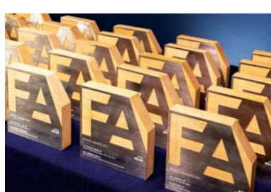
▲ 「2021金融科技大獎」分成18個領域,共頒發54個獎項

經濟通(ET Net)面對著數碼科技的不斷進步,也能保持著獨特的市場觸覺,竭力地提供成熟的金融監管制度和嶄新的數碼技術,促進本地的金融科技技術的發展。承著金融科技日新月異的改革,和市場在新冠肺炎持續的變化之下,由經濟通(ET Net)主辦的「2021金融科技大獎」透過網上頒獎典禮順利頒發獎項予得獎者,獎項劃分成18個領域,共頒發54個獎項及3個年度大獎。今年大會主題是「Building a Brighter Green Future Together 共建更美好的綠色未來」為主題,在金融科技已成大勢所趨之際,各持份者如何善用金融科技為本地添加簇新的綠色科技和ESG的元素,在新常態下的挑戰,有效地加強企業的風險管理和在投資決策上有前瞻性的正面影響。