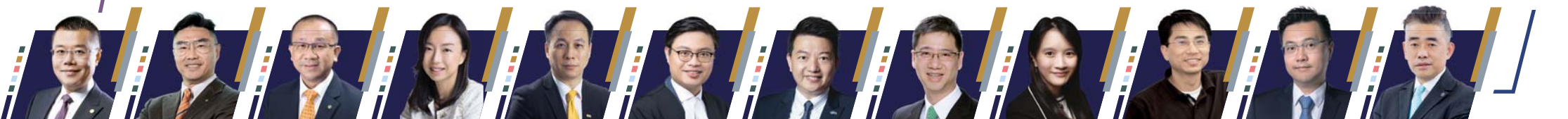
排名不分先後,以評審英文姓氏字母排列