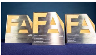
▲ 「2021金融科技大獎」三個年度大獎

「2021金融科技大獎」承蒙下列一眾來自金融科技界和資訊及通訊科技界的業界領袖組成專業評審團,根據創新和創意、功能、市場潛力、裨益以及影響五大評準則,甄選出傑出企業。最後由恒生銀行有限公司脫穎而出奪得「2021金融科技大獎」年度大獎;香港上海滙豐銀行有限公司奪得「2021金融科技市場策劃大獎」年度大獎;平安壹賬通銀行(香港)有限公司則奪得「2021金融科技大獎-初創企業」年度大獎。