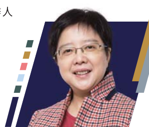
▶ 評審主席兼智慧城市聯盟創辦人及榮譽會長 鄧淑明博士,JP

本屆評審主席兼智慧城市聯盟創辦人及榮譽會長鄧淑明博士,JP亦代表一眾評審讚揚各得獎機構在逆境之中迎难而上,創造出各種新穎及多元化的解決方案。